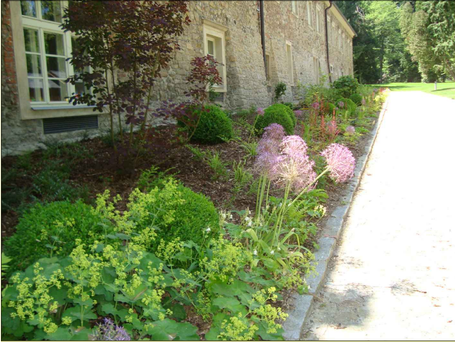
Buxus sempervirens - zimostráz tvarovaný do koule - záhony za pódium a podél cesty